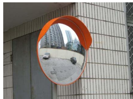
PARA ESPEJO DE 60 CMS